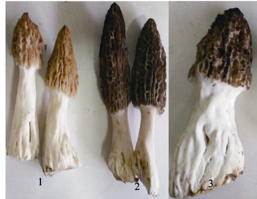
1—生长初期; 2—生长中期; 3—生长后期

与菌柄紧相连, 尖端分枝交织成网格状, 阶段 2 为生长中期, 菌盖变为深棕色或褐色, 阶段 3 为生长后期, 菌柄直径达到 2~3 cm, 基部膨大, 呈现不规则凹槽。所有羊肚菌均由食用菌类专业人员鉴定为粗柄羊肚菌。新鲜羊肚菌清洗干净后于 70 °C 干燥, 粉碎备用。